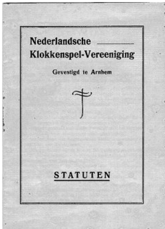
Voorzijde van de statuten van 1928

In de te hanteren middelen was ook sprake van een accentverschuiving: niet langer alleen de bouw van nieuwe, maar ook de verbouw van bestaande beiaarden 'tot zo volmaakt mogelijke en uniform ingerichte klokkeninstrumenten' werd nadrukkelijk genoemd. Dit opende de mogelijkheid tot de snel populair wordende uitbreiding van oudere instrumenten tot vier octaven en het vervangen of herstemmen van historische klokken. Het geven van adviezen werd uitgebreid tot