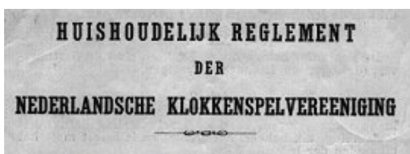
Gedeelte van de voorzijde Huishoudelijk Reglement van 1928

De gewone ledenvergadering wordt gehouden 'vóór 1 Mei, zoo mogelijk in April'. Die moet in elk geval een kascommissie van twee leden benoemen en kan ook bepalen waar de volgende 'gewone ledenvergadering' wordt gehouden. Evenals voor de bestuursvergaderingen moet er een notulenboek worden bijgehouden. 6