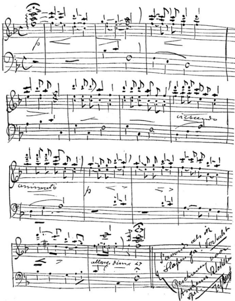
Compositie van Jef Denyn, geschreven na zijn bezoek aan Arnhem in 1913

boom. Maar in het Hollandsche landschap, in onze atmosfeer, is hij tot schoonheid omgetooverd. Zoo geeft ook het automatisch spel onzer torens op zich zelve gebrekkige muziek. Maar aan onze steden geeft het een bekoering, die wij voor geen goud zouden willen missen.' Hij vervolgt echter met: 'Al kan het mechanisch spel verbeterd worden, kleurloos en zielloos zal het natuurlijk altijd blijven. Het persoonlijk spel van een kunstenaar alleen kan bewerken, dat het behoud van het klokkeninstrument algemeen gerechtvaardigd wordt geacht en men het automatisch spel op den koop toe voor lief neemt.' 2 Het klokkenklavierspel dient echter een hoger doel, het zal weer een kunstuiting van de tijdgeest en gemeenschapszin in Nederland moeten worden. Nu is onder historici geen begrip zoveel misbruikt en omstreden als het vage 'de tijdgeest', maar enkele aspecten daarvan zijn voor het tweede decennium van